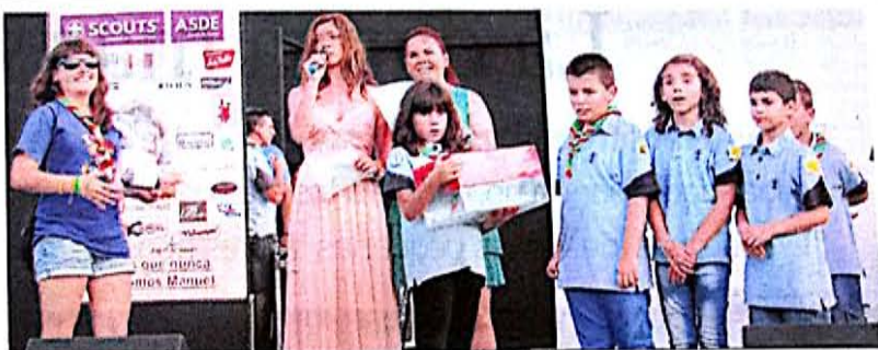
Entrega de lotes donados por empresas ceutíes a los ganadores.