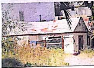
Viviendas ilegales, en pleno centro.

Alumbrado de menor intensidad, para ahorrar ▶2-3