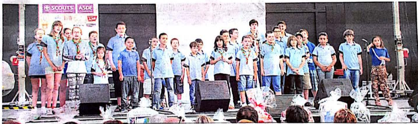
El Grupo de Scouts de Ceuta inauguró el festival con el himno y clausuró el mismo con la canción con la que compitieron en el certamen de Granada, celebrado en el pasado mes de mayo.