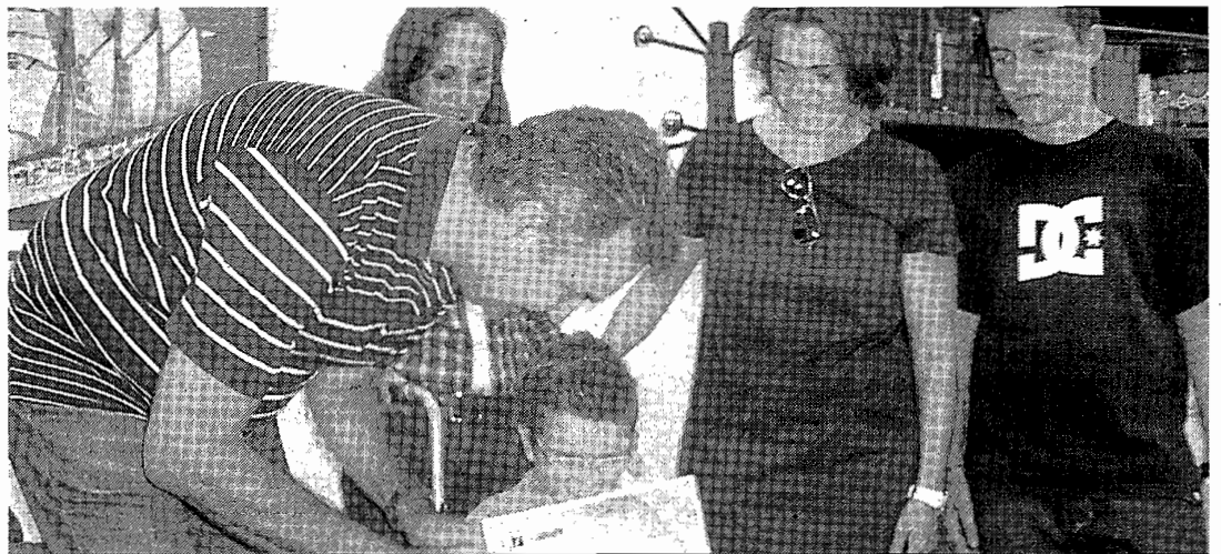
El acto de entrega del cheque se celebró en el IES Siete Colinas.